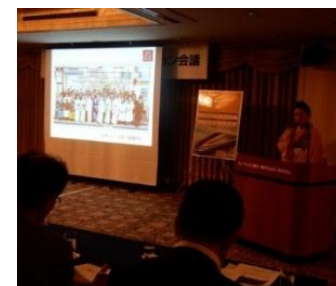
<観光プレゼンテーション>