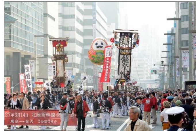
<能登キリコ祭りのパレード参加(H26.10)>