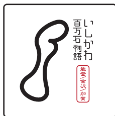
構成要素のバランスを変えない