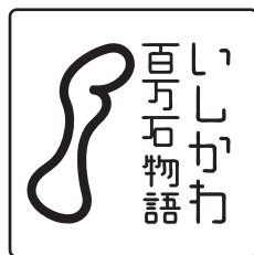
構成要素を削除しない