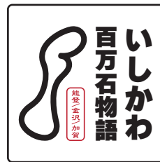
規定の書体を変えない