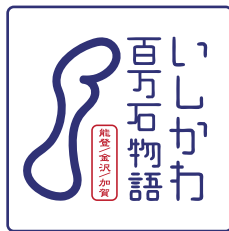
指定以外のカラーを使用しない