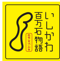
タイプ A の白地部分をヌキにしない