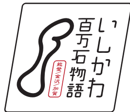
いかなる変形もしない