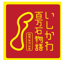
タイプ B の白地部分をヌキにしない