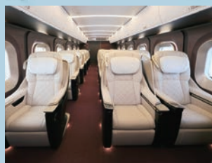
グランクラス客室

首都圏と北陸新幹線沿線をつ結び、日本の伝統文化と未来をつなぐという意味から、「和」の未来を新型車両のデザインコンセプトとしています。新型車両は12両編成で、プレミアムブランドである「グランクラス」を導入しました。大人の琴線に触れる「洗練さ」と、心と体の「ゆとり・開放感」で、新たな鉄道の旅を提供します。