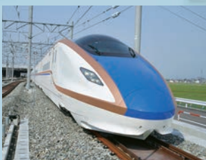
北陸新幹線新型車両N700S系