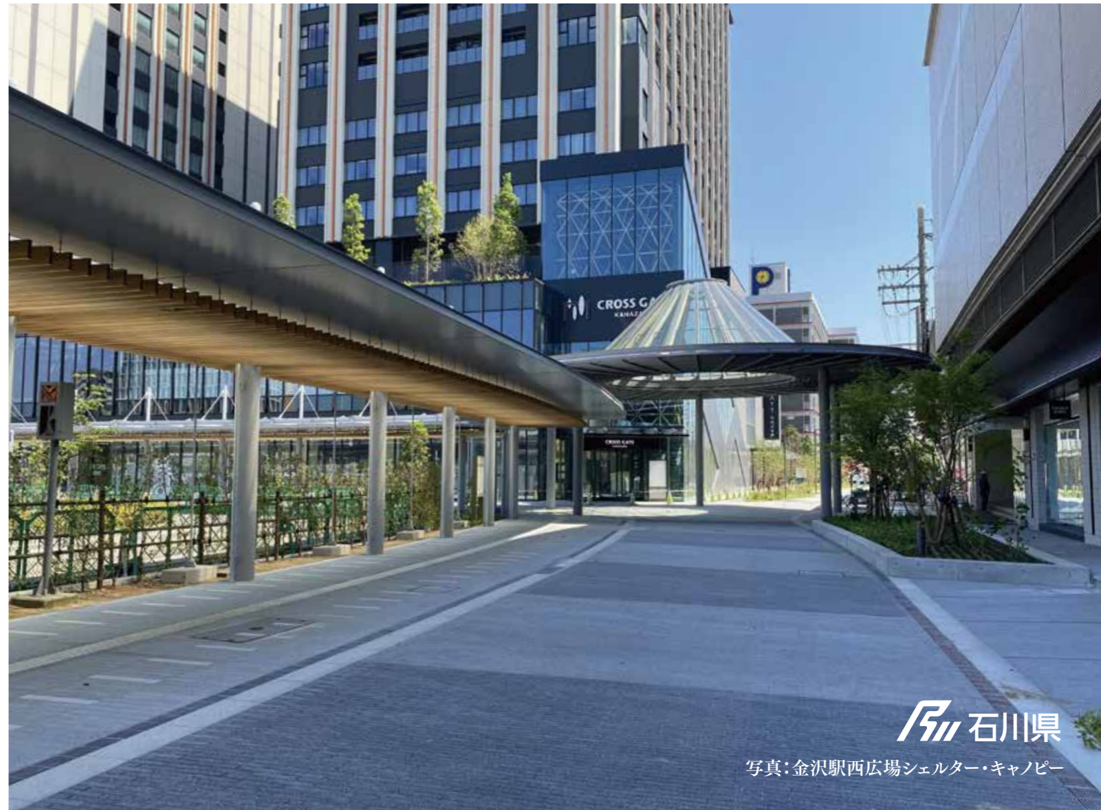
写真:金沢駅西広場シェルター・キャノピー