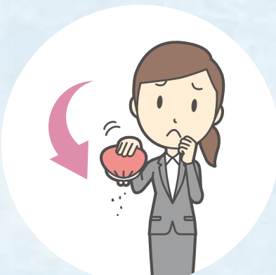
いま きゅうりょう 今までよりも給料を へらされた