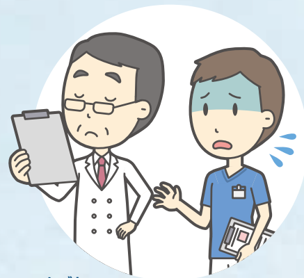
しごと こ 仕事に来なくてもいい といわれた(解雇)