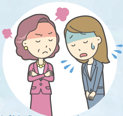
しごとちゅう おこ 仕事中にきつく怒られた (パワーハラスメント)