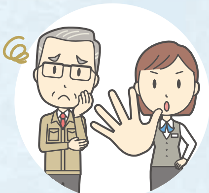
きぼう ばしょ しごと 希望しない場所で仕事を させられた(配置転換)

ろうどういいんかい 労働委員会とは・・・ いしかわけんろうどういいんかい 石川県労働委員会には、いろいろな分野から にん だいひょう 15人の代表があつまっています。はたらく人た しごと こま かいけつ ちが仕事で困っているとき、それを解決するた つく いしかわけん そしき めに作られた石川県の組織です。