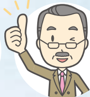
かいしゃ だいひょう 会社の代表