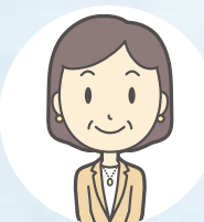
しゃかい だいひょう 社会の代表