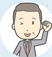
ひと だいひょう はたらく人の代表