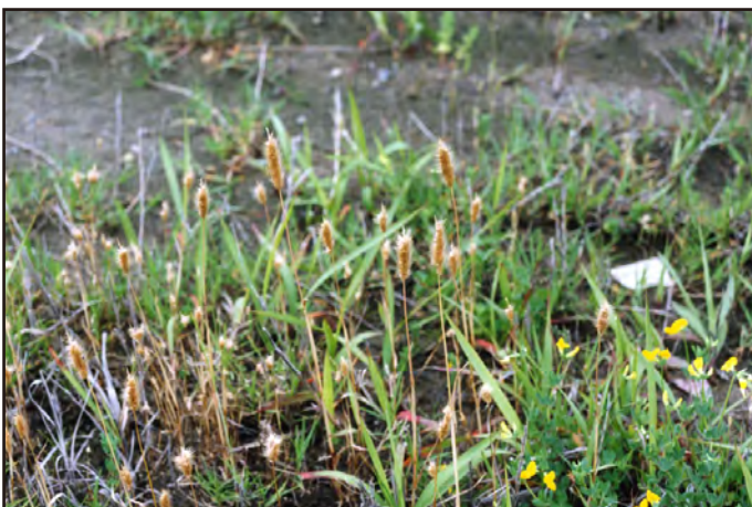
小野ふみゑ・1996年6月16日・白山市

生育地の一部は能登半島国立公園内にある。 渡辺定路. 2003. 改訂増補 福井県植物誌. 福井新聞社.