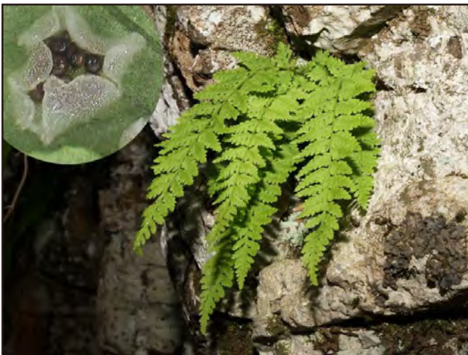
林 二良・2007年6月13日・南加賀・(孢子のう) 本多郁夫