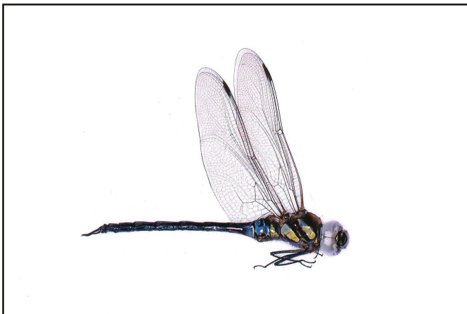
標本提供者: 武藤明

武藤 明 1998. トンボ目. 石川県の昆虫 : 49-57. 石川県自然保護課.