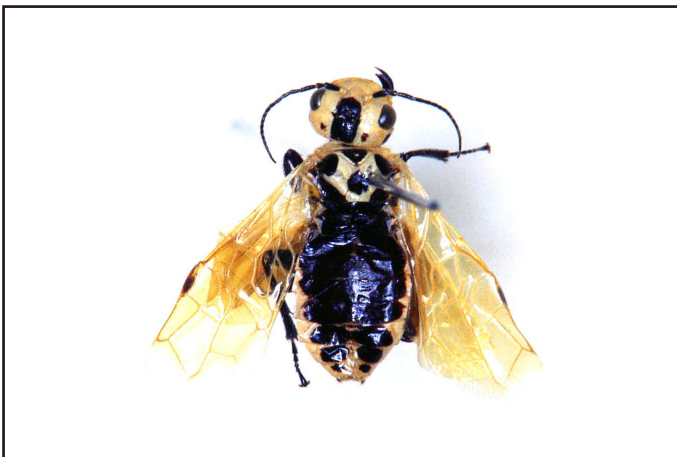
標本提供者：富樫一次

参考文献 Takeuchi, K. 1938. A systematic study on the suborder Symphyta (Hymenoptera) of the Japanese Empire (1). Tenthredo , 2:173-229.