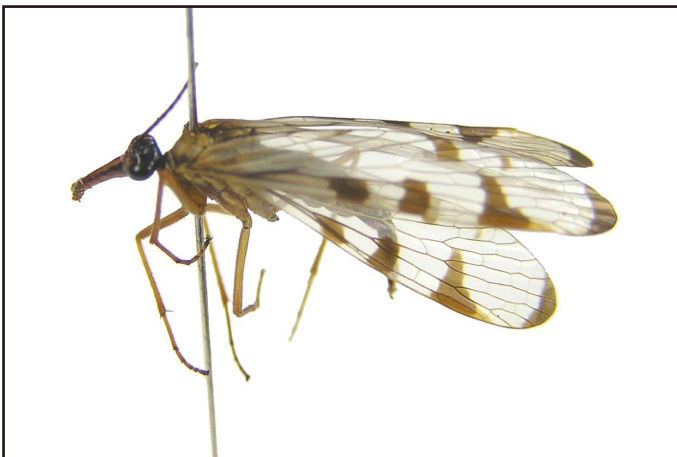
標本提供者: 富樫一次

Miyamoto, S. 1978. Geographical forms in the Leucoptera - Group of the genus Panorps Linnaeus (2) (Insecta, Mecoptera). Jour. Chikushi Jogakuen Junior College, (13) : 33-44.