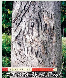
カキの木に残った爪あと