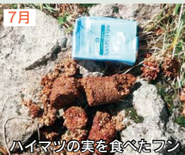
ハイマツの実を食べたフン