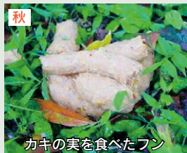
カキの実を食べたフン