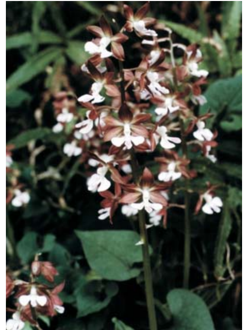
写真：CD-ROM版「石川県の絶滅のおそれのある野生生物」(2000年)より抜粋

最近是人里近くではほとんど見られなくなりました。それはもともと数も少なかったのですが、近年は園芸用にとられたり、林が管理されなくなったこともあって、急激に少なくなっています。