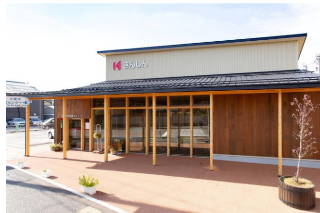
金沢信用金庫 大聖寺支店【加賀市】

設計者：株式会社高屋設計環境デザインルーム 施工者：小中出建設株式会社 特 徴：CLTを活用した金融施設として国内で2例目（北陸では初） 県産材使用量：175.00㎡（スギ、能登ヒバ）