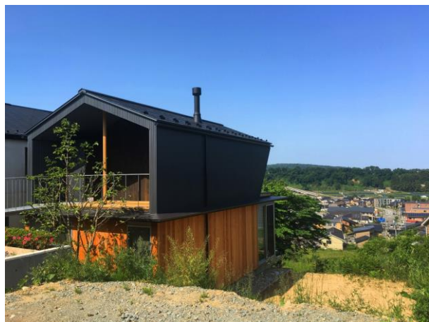
田上新町見晴らしの家【金沢市】

設計者：谷重義行建築像景 施工者：有限会社けやき住建 + ライフデザイン 特 徴：優れた意匠性ととも、内外装に多くの県産スギを使用 使用県産材使用量：20.35㎡（スギ）