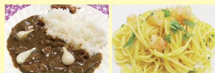
●砂丘の真珠らっきょうカレー ●フグノコパスタネオ