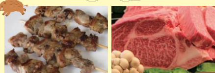
●いしかわジビエ ●能登牛