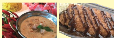
●ミルク王国ウチナダ ●金沢カレー