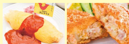
●宝達志水オムライス ●かほくコロッケ