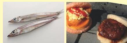
●金沢メギス ●ひやくまん穀ごはんば〜が