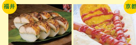
●焼き鯖すし ●京都向日市激辛商店街 (クレープのお店 オンリー)