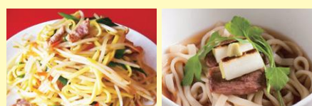
●小松名物塩焼きそば ●加賀のかがやき