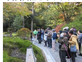
*写真は、昨年度の様子