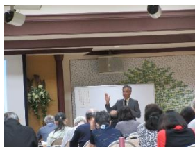
*写真は、昨年度の様子