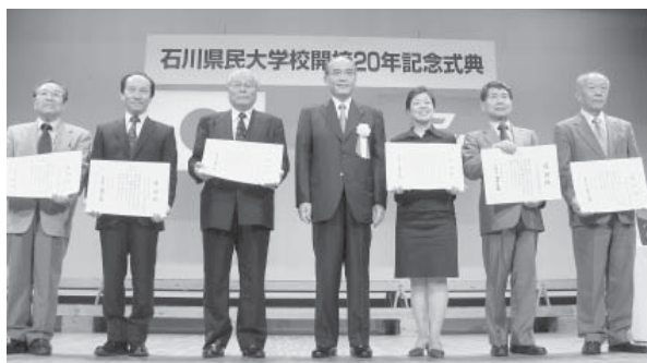
石川県民大学校開校20年記念式典(5月)

平成22年5月21日発行 / 石川県立生涯学習センター 〒920-0962 金沢市広坂2-1-1 石川県広坂庁舎 TEL.076-223-9571 生涯学習センターホームページ http://www.pref.ishikawa.jp/shakyo-c/