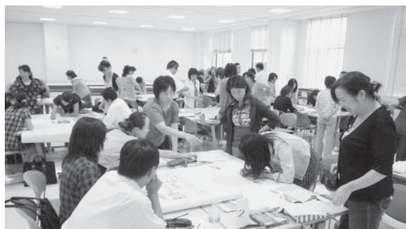
金沢教育事務所管内生涯学習研修会(7月)