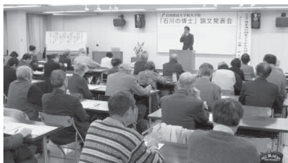
「石川の博士」論文発表会(1月)