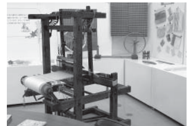
鹿西高校生徒作品展 (12/16～1/17)