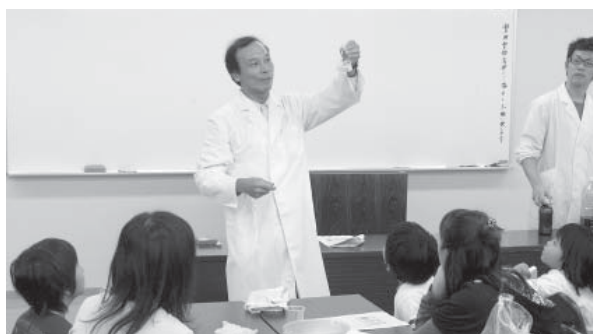
びっくり科学教室(11月)