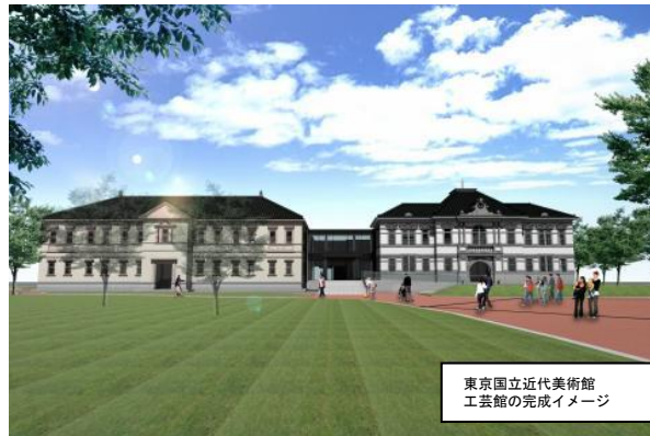
東京国立近代美術館工芸館の完成イメージ

県内でも歴史文化の集積が最も高い兼六園周辺。県立美術館に隣接する敷地に整備する東京国立近代美術館工芸館の移転に向け、三月に建設工事に着手しています。金沢城公園は、六月に鼠多門（ねずみたもん）、十月に鼠多門橋の復元整備工事に着手しました。さらに、二の丸御殿復元の可能性を検討する委員会を設置しました。