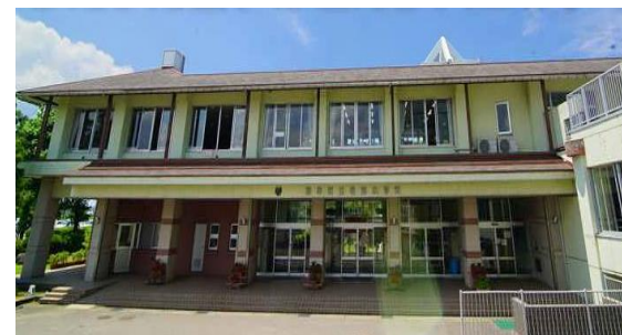
邑知小学校校舎棟照明LED化