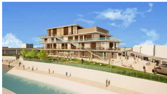
羽咋市にぎわい交流拠点『Lakuna はくい』 CASBEE、ZEBready認証取得予定 ※2024年夏頃オープン