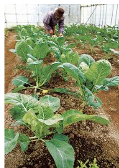
育成中の ブロッコリー