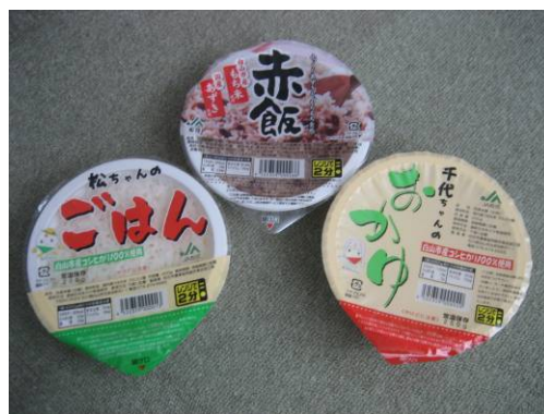
無菌包装米飯ごはん、赤飯、おかゆ