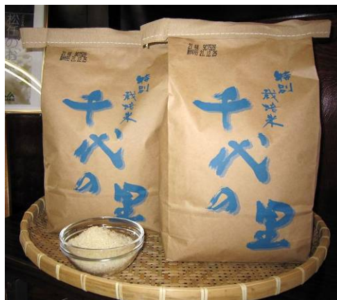
千代の里（特別栽培米）