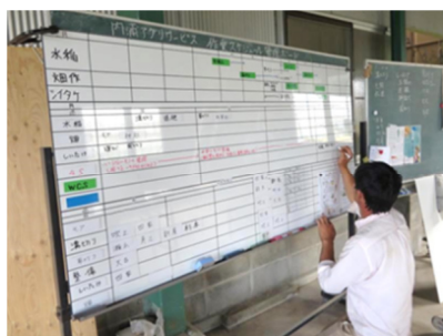
作業管理ボード設置・活用（情報共有）

今後、農業生産法人Aにおいては、WCS以外の部門でもトヨタ生産方式の実践を進め、経営体全体の経営改善につながるよう支援していきます。また、この事例をモデルに、他の大規模経営体に向けて、トヨタ生産方式を普及していきたいと考えています。