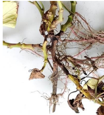
図2 地際部の腐敗症状