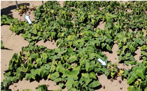
図1 ほ場の発生状況

(3) 本菌の宿主植物はヒルガオ科植物のみで、主に罹病したサツマイモ塊根やつるで伝搬する。また、罹病残渣上で越冬し、翌年の伝染源になる。