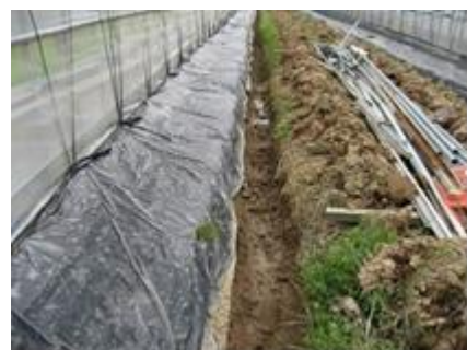
ハウス周辺の排水溝