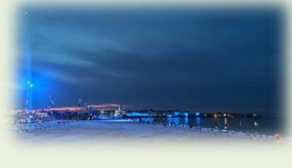
金沢港 クルーズ ターミナル