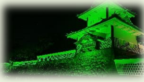
金沢城公園 石川門