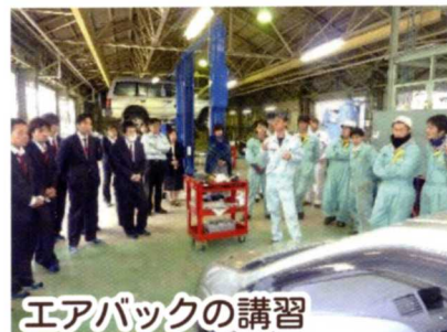
エアバックの講習

石川ダイハツ販売(株) ネットトヨタ石川(株) 石川トヨタ自動車(株) 北陸スバル自動車(株) 石川トヨペット(株) (株)北陸マツダ 石川日産自動車(株) (株)ホンダカーズ石川 石川日野自動車(株) (株)ホンダカーズ北陸 (株)オートバックス 名鉄自動車(株) (株)スズキ自販北陸 UDトラックスジャパン(株) トヨタカローラ石川(株) ほか