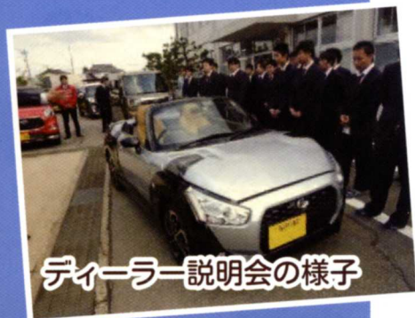
ディーラー説明会の様子