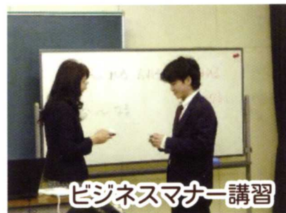
ビジネスマナー講習