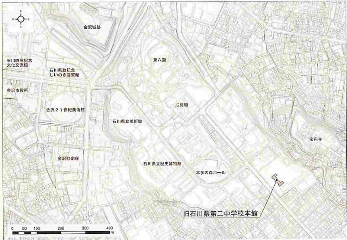
旧石川県第二中学校本館の位置