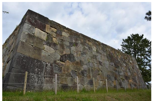
小松城跡本丸櫓台