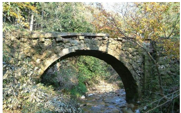
滝ヶ原アーチ石橋群