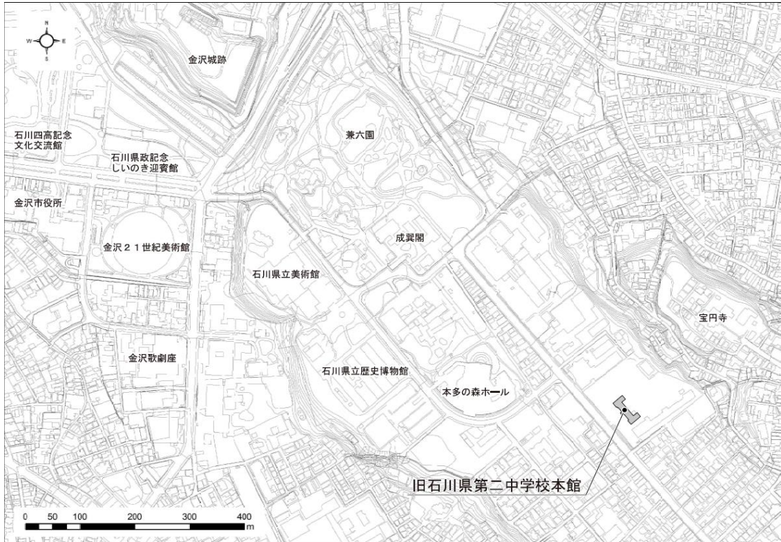
旧石川県第二中学校本館の位置