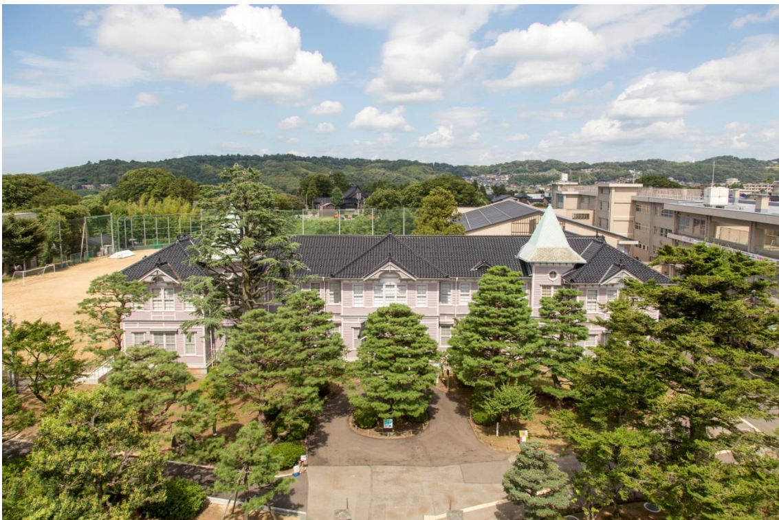
旧石川県第二中学校本館全景（南西から）