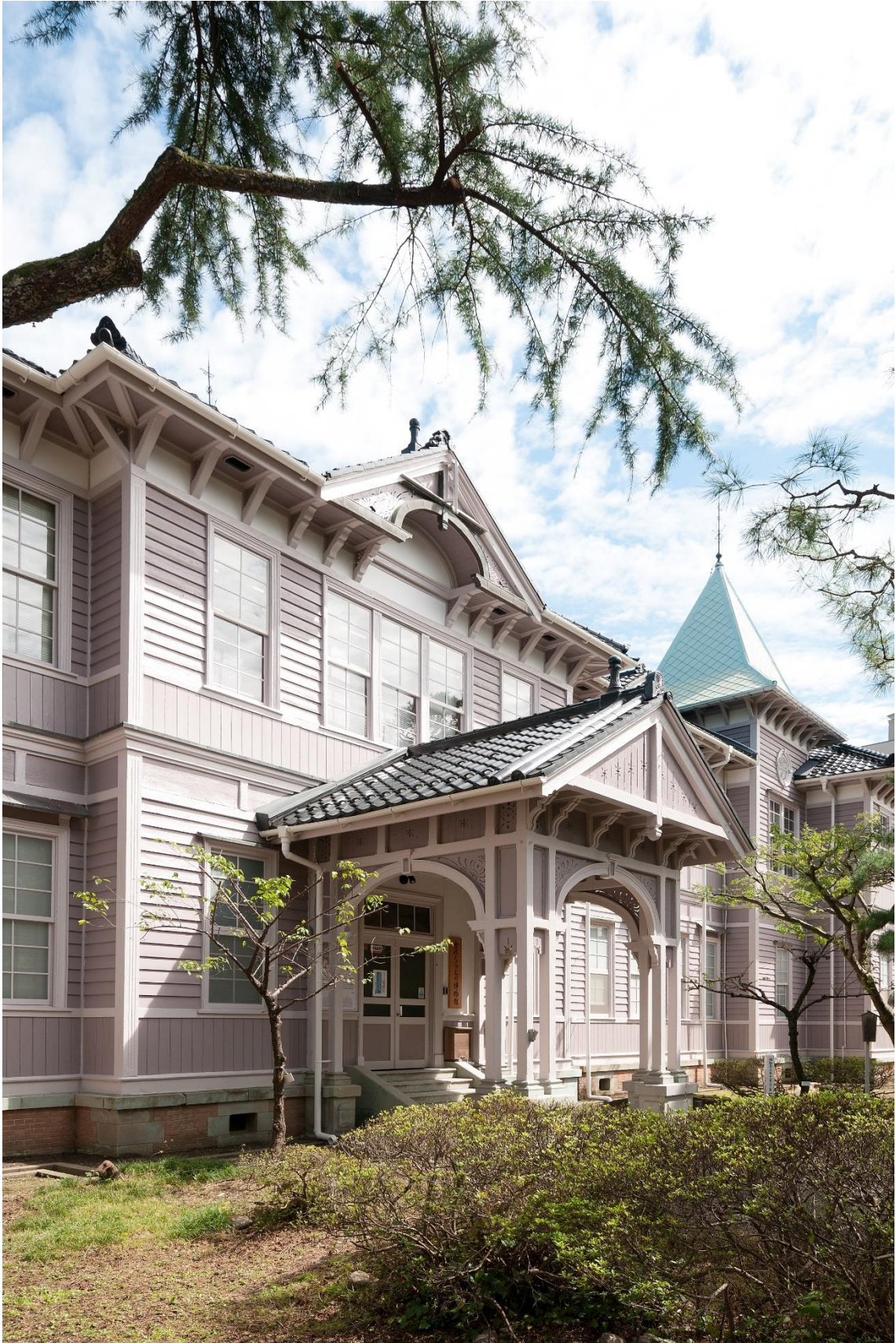
旧石川県第二中学校本館近景（西から）