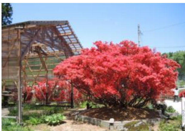
芦田家ののときりしまつつじ