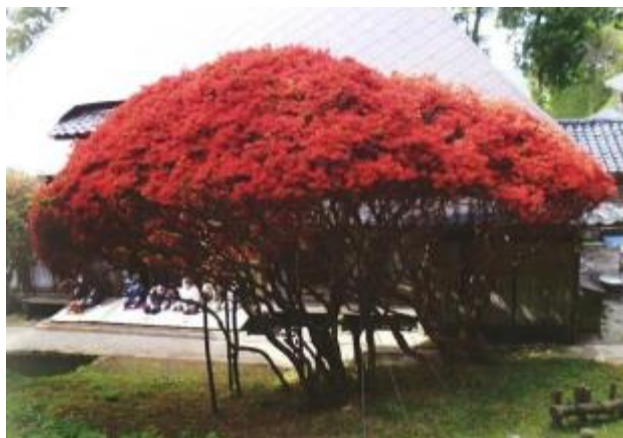
大谷ののときりしまつつじ

「のときりしまつつじ」は、古くから能登の寺社や旧家の庭園などに植えられ、花を鑑賞する文化があったことを示し、能登の人々の拠り所となっていたことを物語る。