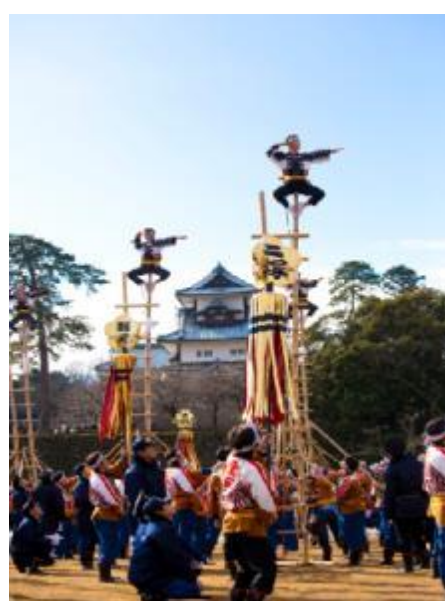
加賀とびはしご登り