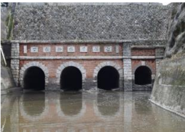
手取川七ヶ用水施設群