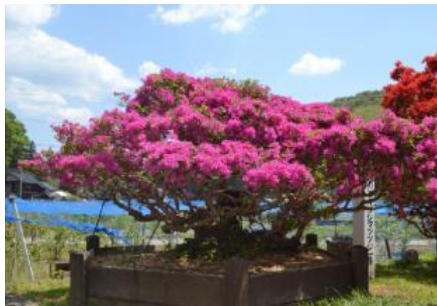
五十里ののときりしまつつじ