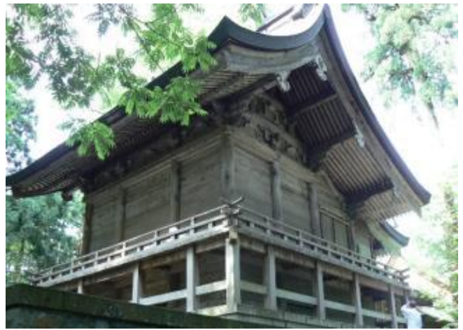
白山比咩神社本殿