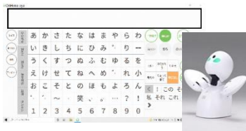
OriHime eye + Switch (株式会社オリィ研究所)