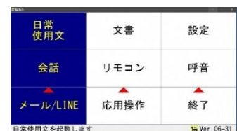
伝の心 (株式会社日立ケーイーシステムズ)