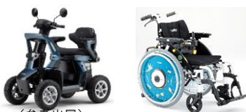
(参考出展) 屋外用電動車椅子・車椅子アクセサリ (ヤマハ発動機株式会社)