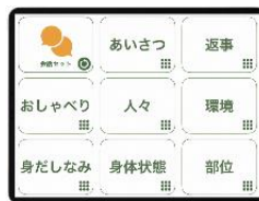
指伝話 (有限会社オフィス結アジア)