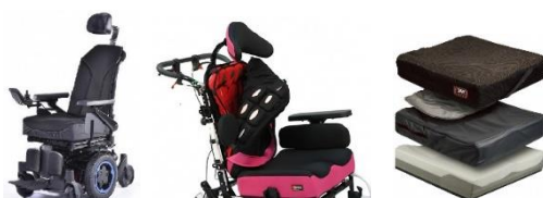
多機能電動車椅子・姿勢保持部品・クッション (サンライズメディカルジャパン株式会社)