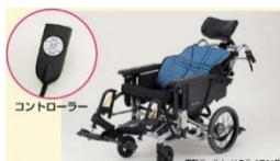
電動姿勢変換車椅子・電動昇降歩行車 (日進医療器株式会社)