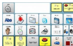
TCスキャン (株式会社クレアクト/ライフハック)