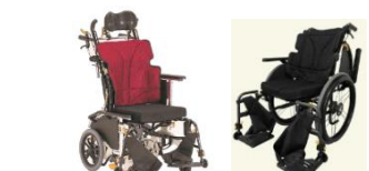
姿勢変換車椅子・多機能車椅子 (株式会社松永製作所)