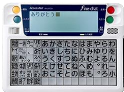
ファイン・チャット (アクセスエール株式会社)

今年度「重度障害者用意思伝達装置装用訓練等支援事業」を行い、新たにコミュニケーション支援に使用できる機器をそろえました。「使い方が分からない」「触ったことがない」方のために、機器の具体的な使い方の説明、実際に体験できるコーナーです。