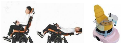
コンパクト電動車椅子・座位保持装置用電動遊具 (株式会社今仙技術研究所)

問い合わせ先：石川県リハビリテーションセンター支援課 (076)-266-2860 支援課