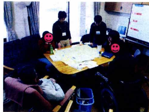
金沢マップ作りの様子

この教室に来るために、日頃の活動を考えています。次は何を話そうか等を考えて生活しています。