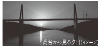
高台から見る夕日(イメージ)

コース 風と砂の館入館(内灘の歴史を見る) → 恋人の聖地・幸せの鐘付堂 → 64mの高台に登り夕日を眺める(約3km) 開催日 11/27(日)までの毎週日曜16:00~18:00 参加費 200円(風と砂の館入館料込み) お申し込み 内灘町観光協会 ☎076(286)6708 (平日8:30~17:15 3日前15:00まで受付)