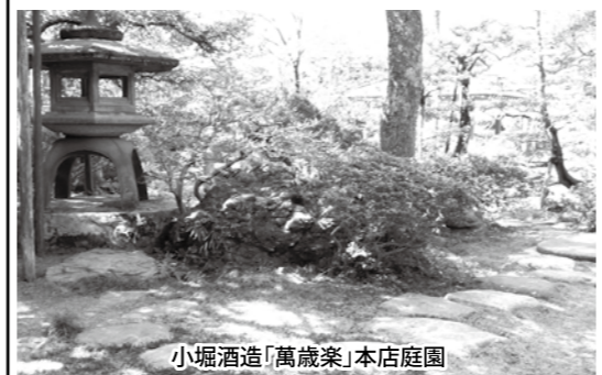
小堀酒造「萬歳楽」本店庭園