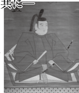
初代本多政重肖像画

所在地/金沢市出羽町3-1 開館時間/9:00~17:00(入館は16:30まで) 入館料/一般500円 大・高・中学生350円 小学生250円