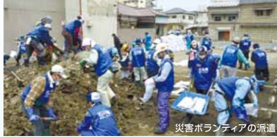
災害ボランティアの派遣

3月11日に発生した東日本大震災は、大津波により多くの人命が失われるとともに、東京電力福島第一原子力発電所の事故など、未曾有の大災害となりました。県では、地震発生直後から職員等の派遣や物資の提供など、被災県への支援を開始するとともに、県内に避難してこられた方への支援に取り組みました。