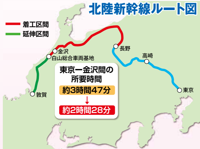
北陸新幹線ルート図

政府は、北陸新幹線白山総合車両基地-敦賀間の建設に向けて手続きを進めることを決定しました。これにより、石川県の全区間で新幹線がつながり、福井県や関西地域とのさらなる交流促進が期待されます。