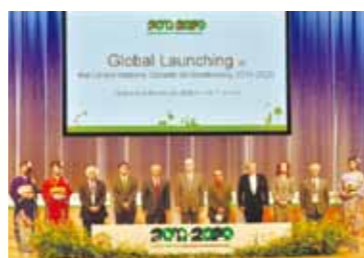
国連生物多様性の10年国際キックオフイベント

3月、本県の生物多様性の保全に関するさまざまな取り組みや活動の拠り所として「石川県生物多様性戦略ビジョン」を策定しました。「トキが羽ばたく石川の実現」を県民共有の目標として、具体的な取り組みを深化させていくこととしています。