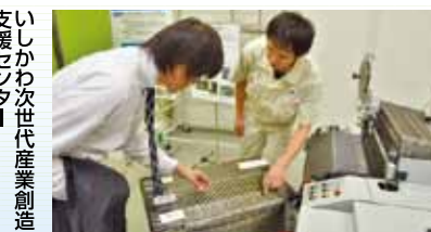
支援センター次世代産業創造

県民総ぐるみでのおもてなし向上に向けて「ほっと石川おもてなし推進協議会」を設立するなど、開業効果を最大限に引き出し県内全域に波及させるための取り組みを加速させています。