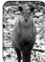
ニホンカモシカ (特別天然記念物)