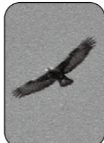
イヌワシ (県鳥・特別天然記念物)