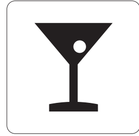
バー Bar 바 酒吧 酒吧