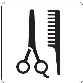
理容／美容 Barber / Beauty salon 이발소/미용실 理发/美容 理髮/美容