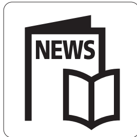
新聞／雑誌 Newspapers / magazines 신문/잡지 报纸/杂志 報紙/雜誌