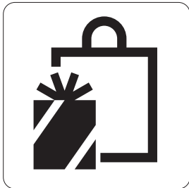
店舗／売店 Shop 집포/매점 店铺/小卖部 店舗/商店