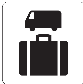
手荷物宅配 Baggage delivery service 수하물택배 行李运送服务 行李寄送服務