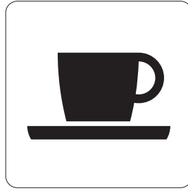
喫茶・軽食 Coffee shop 차·스낵 咖啡/便饭 咖啡/輕食