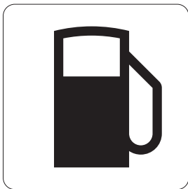
ガソリンスタンド Gasoline station 주유소 加油站 加油站