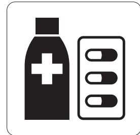
薬局 Pharmacy 약국 药铺 藥局