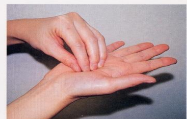
3. 指先、爪の間をよく洗う