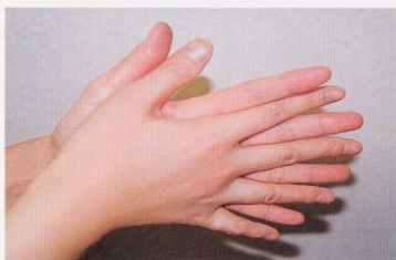
1. 手のひらを合わせ、よく洗う