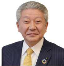
珠洲市長 泉谷 満寿裕

2006年初当選。地域のあらゆる資源を活かし市民と行政がともに取り組む「地域経営」を推進。2017年から3回にわたり「奥能登国際芸術祭」を開催。