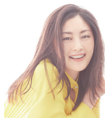
俳優 常盤 貴子

兵庫県神戸市出身。1.17のつどい実行委員長。能登半島地震発生後、能登キリコ祭りへの学生ボランティア派遣や「希望の灯り」モニュメント設置を支援。