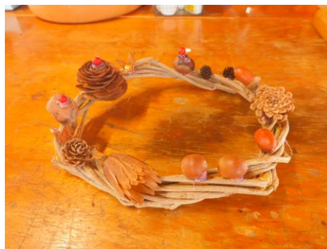
ネイチャークラフト