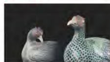
国宝「色絵雑香炉」(右)、重要文化財「色絵雌雄香炉」(左)

会場: 石川県立美術館2階VRシアター 対象: どなたでも(小学生以下は保護者同伴) 料金: コレクション展観覧料が必要(一般370円ほか)