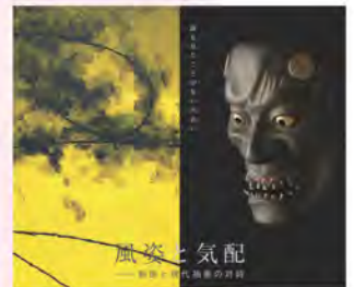
絵画:山本浩二、老松「天馬」| 写真:草彌強(ruvita) 能面:大月光勲、夜風鬼(角切り)| 写真:山崎兼慈