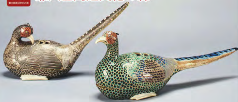
国宝(色絵雉香炉)(右)、重要文化財(色絵雌雉香炉)(左) いずれも野々村仁清 石川県立美術館蔵