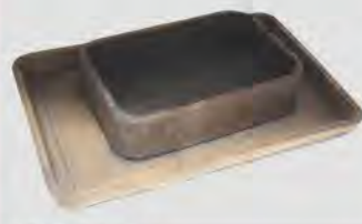
我谷盆 森田信一 作