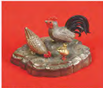
文鎮(寿々姫お輿入れ品)