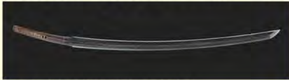
国宝《太刀 銘光世作(名物大典太)》 前田育徳会蔵

北陸新幹線の県内全線開業を記念し、 国宝《太刀 銘光世作(名物大典太)》、 国宝《刀 無銘義弘(名物富田江)》、重 要文化財《短刀 銘吉光(名物前田藤 四郎)》(いずれも前田育徳会蔵)を57年 ぶりに一堂に展示します。 『刀剣乱舞ONLINE』とのコラボとして 「刀剣男士 大典太光世」「刀剣男士 前田 藤四郎」の等身大パネルを設置し、コラ ボ記念グッズを販売します。