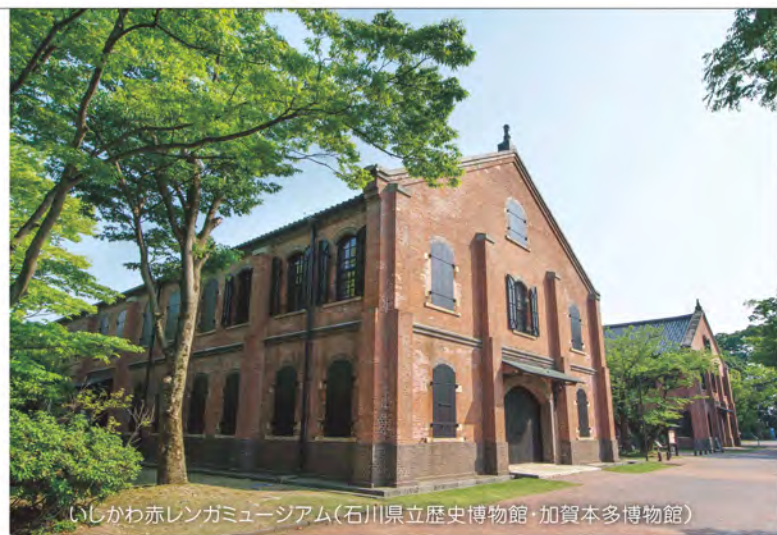
いしかわ赤レンガミュージアム(石川県立歴史博物館・加賀本多博物館)