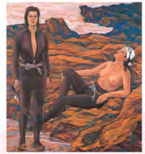
《軸倉島夕遊》羽根万蔵 県立美術館蔵