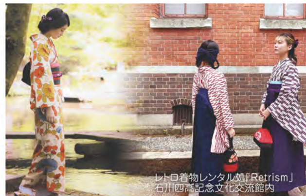
レトロ着物レンタル処「Retrism」 石川四高記念文化交流館内

お問い合わせ 兼六園周辺文化の森等活性化推進実行委員会(石川県文化振興課内) ☎076-225-1371 (平日9:00~17:00) 後援:(公社)石川県観光連盟