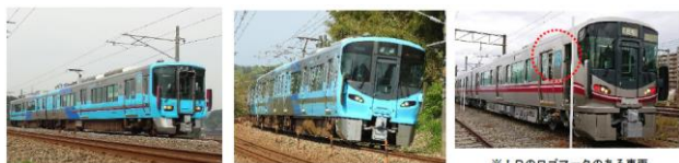
※IRのロゴマークのある車両