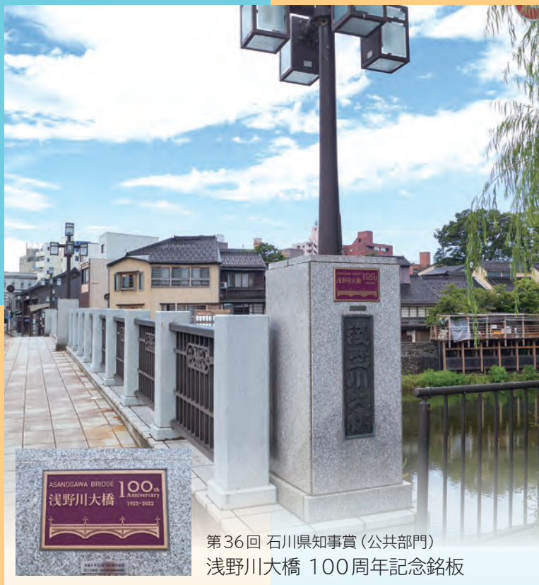
第36回 石川県知事賞（公共部門） 浅野川大橋 100周年記念銘板

都市景観等の向上と屋外広告物への関心を高めることを目的に、優れた屋外広告物に対して広告景観賞を授与いたします。多くの方々のご応募を賜りますようお願いいたします。