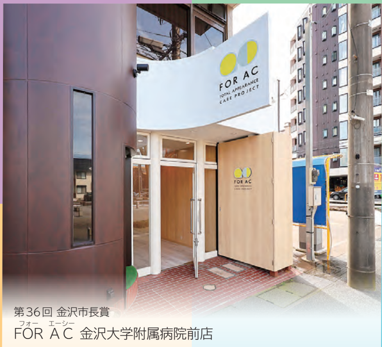
第36回 金沢市長賞 フォー エーシー FOR AC 金沢大学附属病院前店