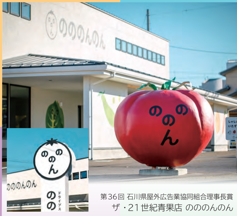
第36回 石川県屋外広告業協同組合理事長賞 ザ・21世紀青果店 のののんのん