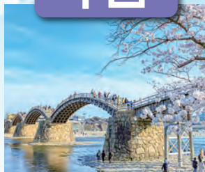
錦帯橋 / 最寄: 岩国錦帯橋空港