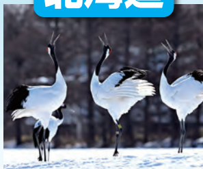
釧路湿原 / 最寄: たんちょう釧路空港