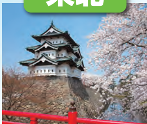
弘前城 / 最寄: 青森空港