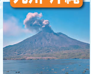
桜島 / 最寄: 鹿児島空港