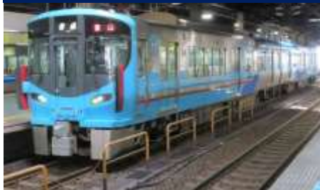
IRいしかわ鉄道線 金沢駅～倶利伽羅間