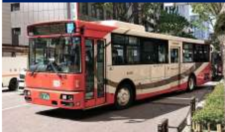
バス1日フリー乗車券エリア内のバス 城下まち金沢観光バス・北陸鉄道バス、西日本JRバス・金沢ふらっとバス