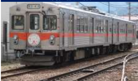
北陸鉄道石川線一部区間 野町駅～新西金沢間