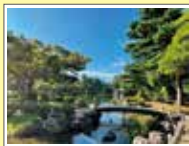
②特別名勝 兼六園 通常料金 320円