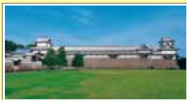
①金沢城公園(菱櫓など) 通常料金 320円