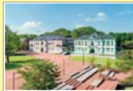
④国立工芸館 料金一例 300円