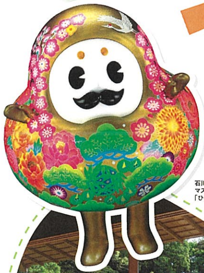
石川県観光PR マスコットキャラクター 「ひやくまんさん」