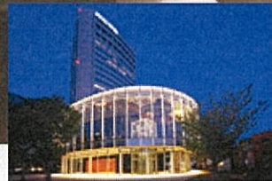
北國新聞赤羽ホール

●申し込みはこちら… https://e-ve.event-form.jp/ event/45439/magical2023