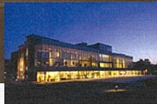
石川県政記念しいのき迎賓館