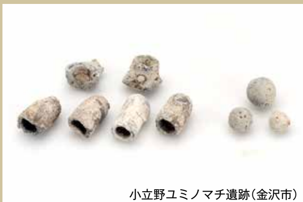
小立野ユミノマチ遺跡(金沢市)