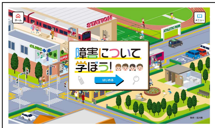
ホームページ画面

http://www.pref.ishikawa.jp/fukusi/manabu/