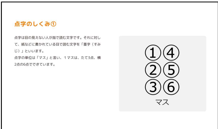
点字のしくみを学ぶページ