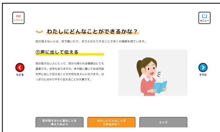
障害の特性や配慮について学ぶページ