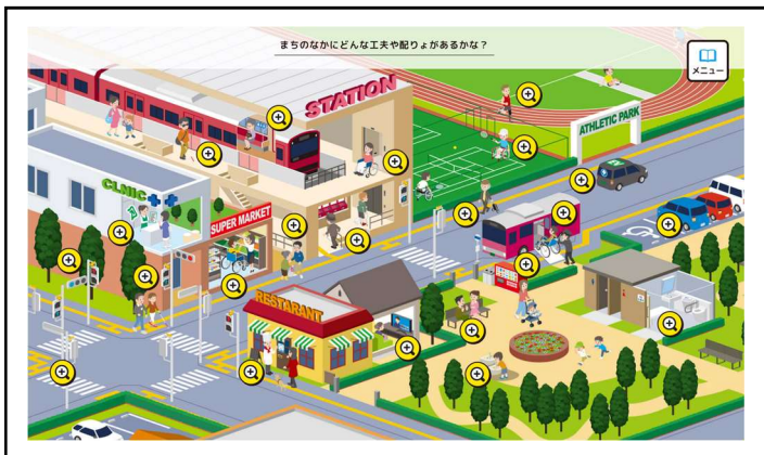
街なかにある工夫や配慮を見つけるページ