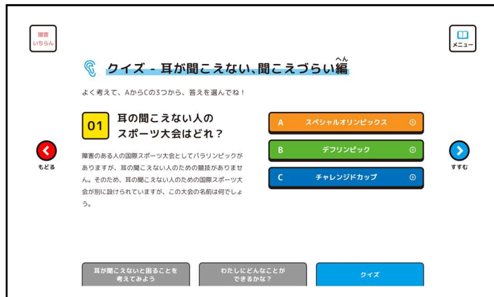
障害に関するクイズ