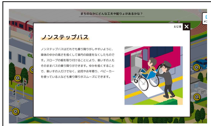
街なかにある虫眼鏡をクリックすると説明が現れる